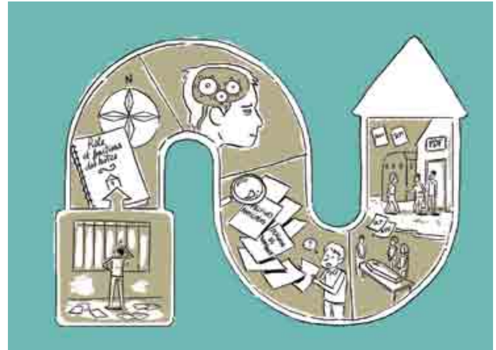
Illustration: Aude Massot

” DÈS QU'IL Y A DÉCÈS, IL Y A DÉSAPPROPRIATION. ”